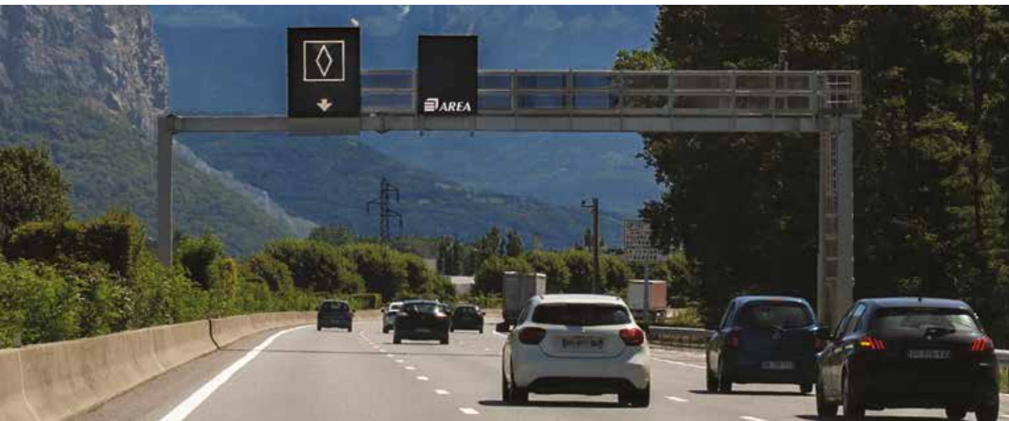
Voie réservée au covoiturage sur l'A48.