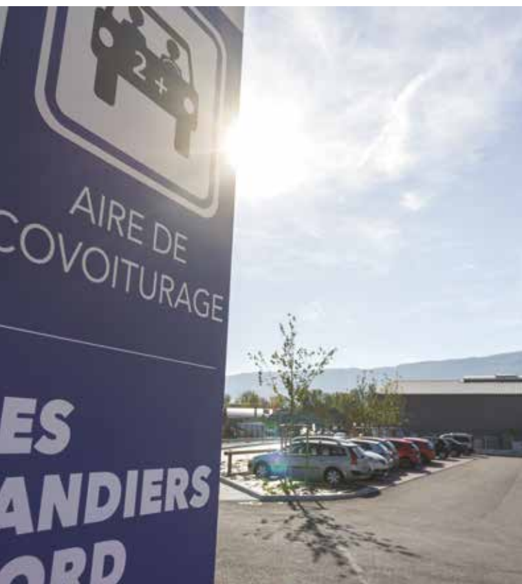
Parking de covoiturage à l'entrée de Chambéry, A43.

Les plantations réalisées le long des autoroutes et sur les aires permettent de capter du CO 2 et ainsi renforcer les puits naturels de carbone. En complément pour chaque kilomètre parcouru par les automobilistes, APRR s'engage à investir dans des dispositifs d'absorption de CO 2 . APRR s'est donné pour objectif une augmentation de 10 % de captation de CO 2 via ses espaces naturels autoroutiers, d'ici à 2025.