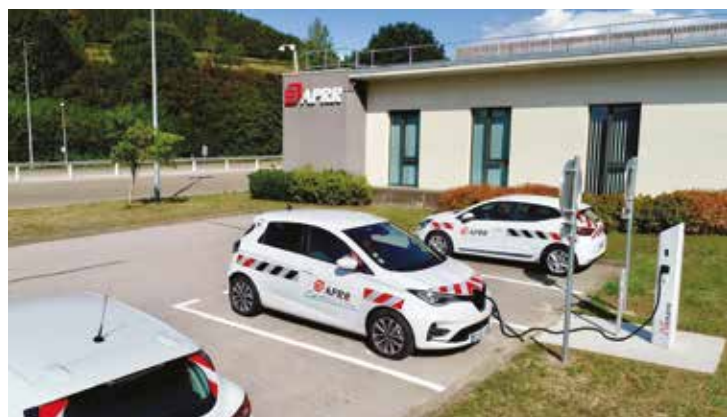
De haut en bas : portique péage sans arrêt, stations de recharge électrique, véhicules électriques de la flotte APRR.