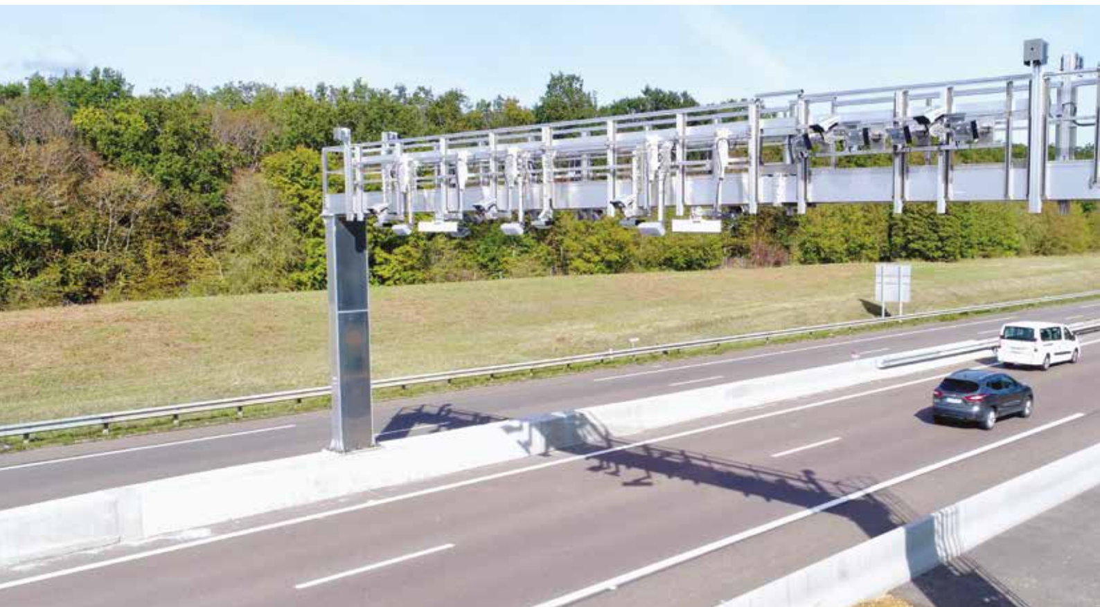
Portique test péage sans arrêt, A31 Dijon.