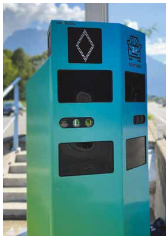
Système de comptage d'occupants.

Développée par la société française Pryntec, cette solution est à ce jour la seule validée par le Cerema 4 .